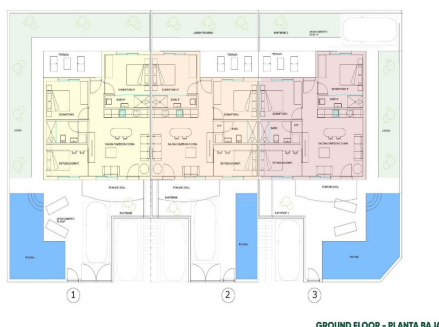
GROUND FLOOR - PLANTA BAJA