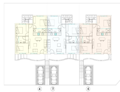
PENTHOUSE - PLANTA ALTA