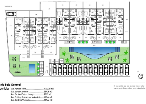
Planta Baja General Superficies | Sup. Parcela Total ..... 1.702,24 m 2 | Sup. Zona Construida ..... 309,28 m 2 | Sup. Piscina (área de agua) ..... 73,72 m 2 | Sup. Trailings (1 plaza por vivienda) ..... 102,44 m 2 | Sup. Jardines Verdes ..... 300,46 m 2

El contenido de los planos tiene valor meramente informativo y no vinculante.