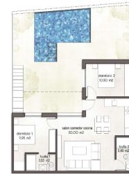
PB / GROUND FL.