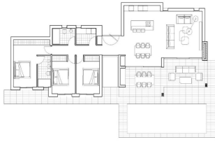
PLAN DE LA VILLA