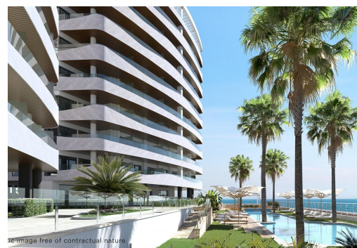
Image free of contractual nature.