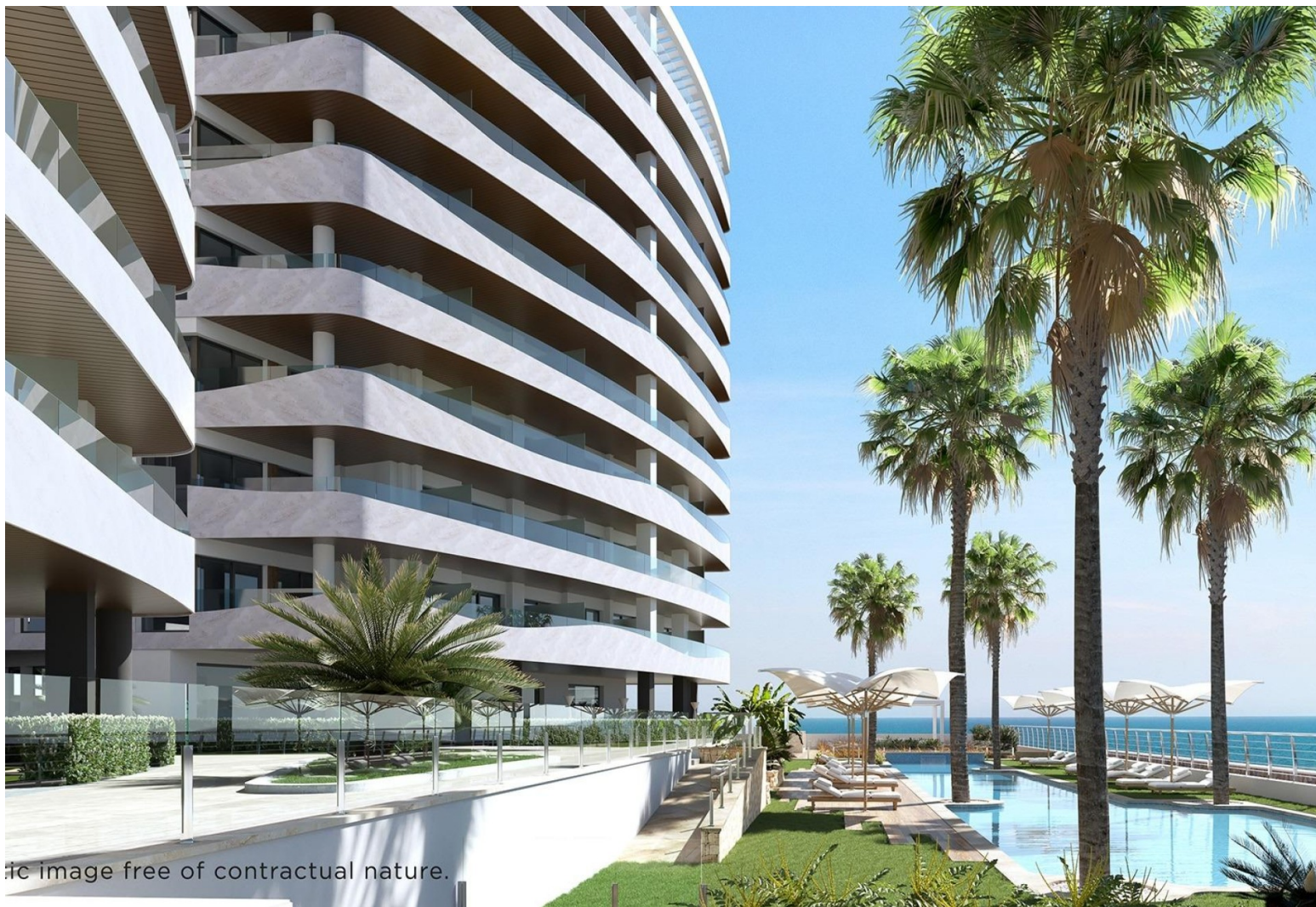
Image free of contractual nature.