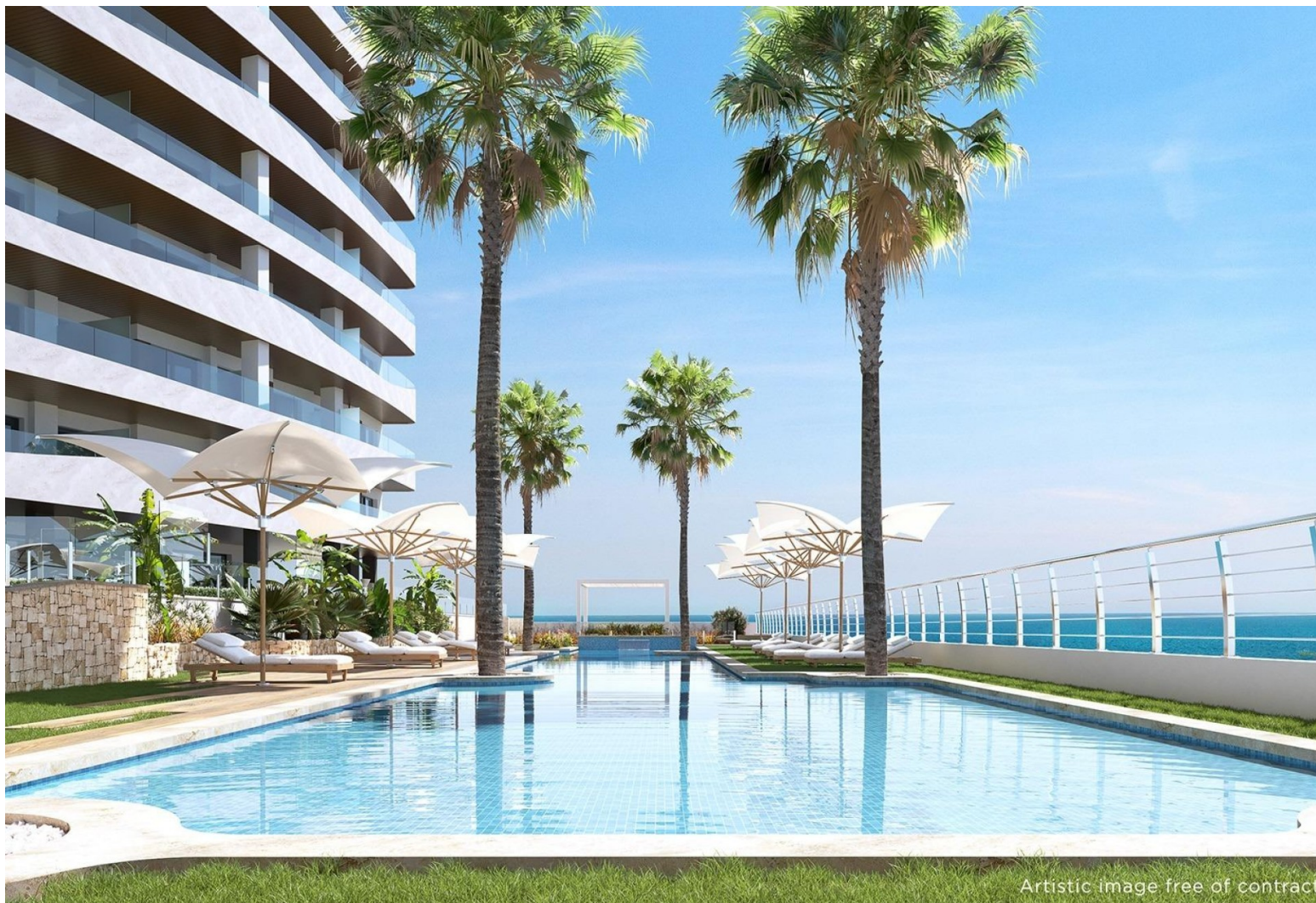
Artistic image free of contract