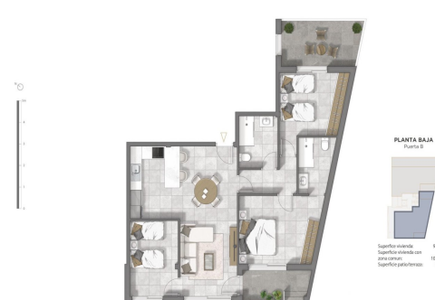
PLANTA BAJA Planta 1 Superficie construida: 86 m 2 Superficie construida sin financiar: 102 m 2 Superficie exterior: 8 m 2