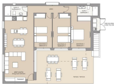
PLANTA BAJA | GROUND FLOOR